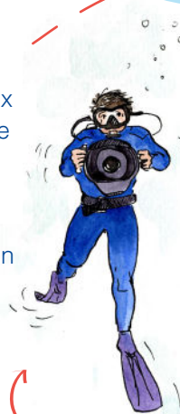
Alexis Rosenfeld , plongeur et photographe

Quota de pêche : Limite réglementaire fixant la quantité maximale d'une espèce qui peut être capturée sur une période donnée.